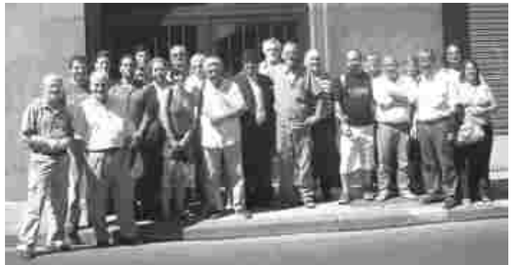
delegación del Comité de Solidaridad frente al INADI